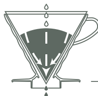
珈琲粉の層 Layer of ground coffee

円すい形なので深い珈琲粉の層ができ、注がれたお湯が中心に向かって流れることにより珈琲粉に長く触れ、成分をより抽出することができます。